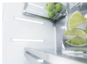
Foto 4: «BrilliantLight» è il nome del concetto di illuminazione della nuova generazione di apparecchi del freddo MasterCool. I pannelli a LED garantiscono un'illuminazione eccellente e non abbagliante del vano frigorifero.

Download testi e foto: www.miele-presse.ch