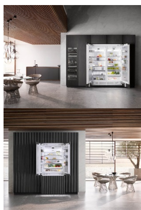
Foto 1: Elevata capienza: gli apparecchi refrigeranti della nuova generazione MasterCool di Miele. Qui un frigorifero e un congelatore affiancati, vicino a un'enoteca della serie.